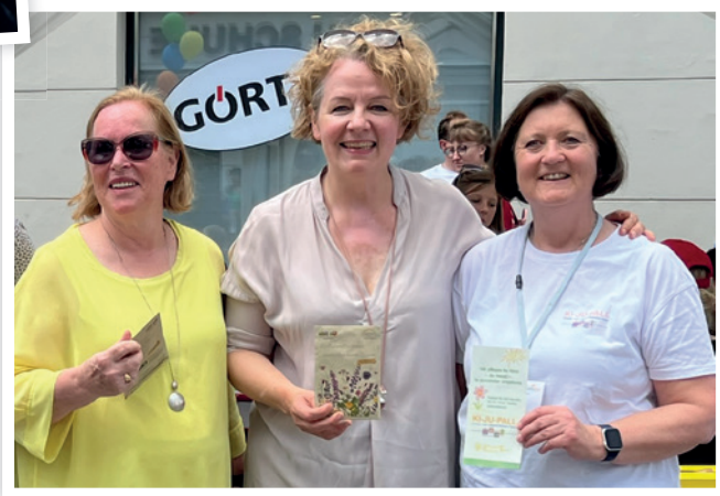
oben: So bewegt wie das Leben selbst drehte sich das Glücksrad für alle Interessierten.