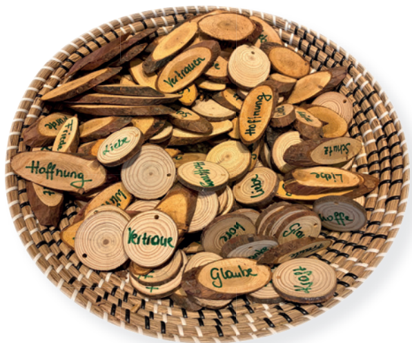
Kleine Baumscheiben als Erinnerung und Trostspender für die Teilnehmer und Teilnehmerinnen der Gedenkfeier

Ein herzliches Dankeschön gilt allen, die an der Gedenkfeier teilgenommen haben, sowie den engagierten ehrenamtlichen Helfer:innen, die mit viel Herz und Einsatz dazu beigetragen haben, diesen Tag würdevoll zu gestalten.